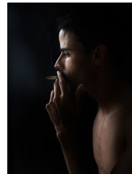
Premio Mercedes Marina 2015