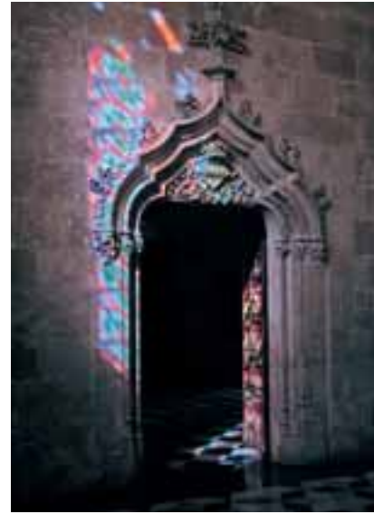
1º Premio. Isabel Escudero