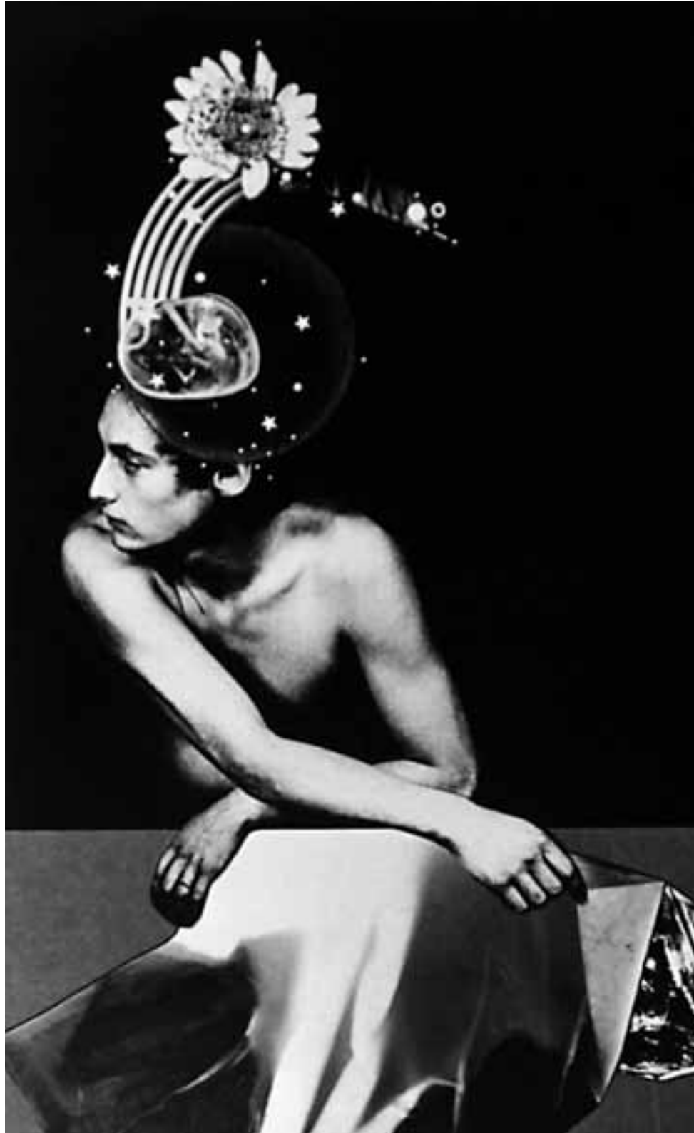
SIN TÍTULO (1978)