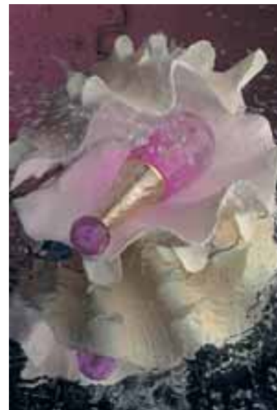
3º Premio. Eva Oriol