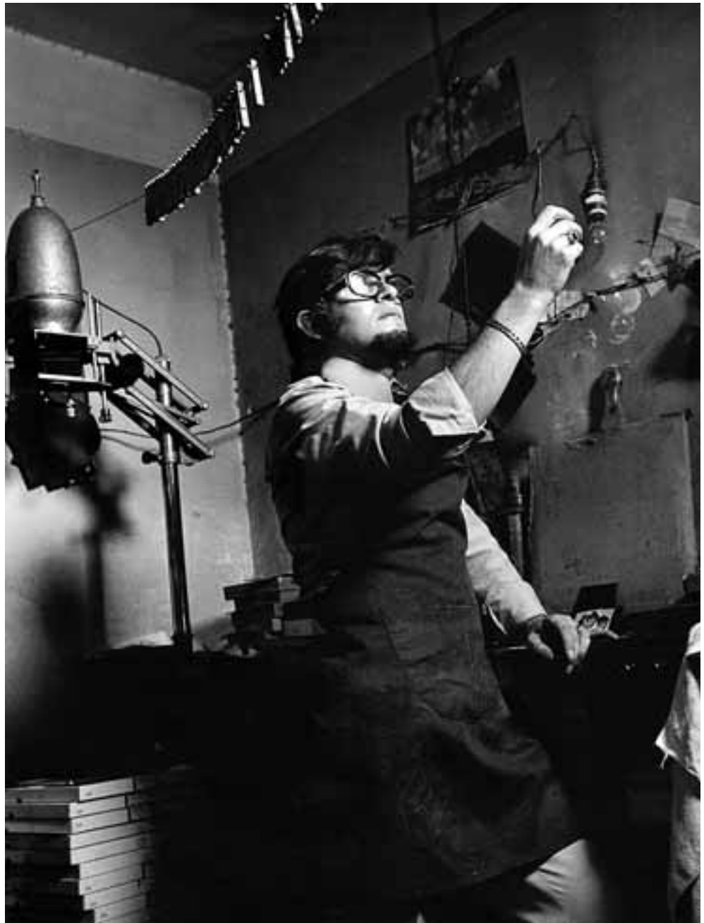
EN EL LABORATORIO (1958)

profesional, que no siempre puede hacer lo que le gustaría sino lo que debe; lo que no significa que por eso no haya también creatividad, arte.