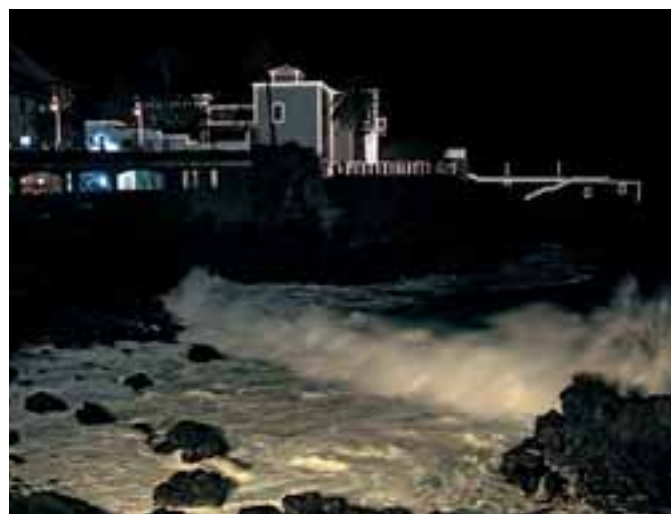
1º Premio. Isabel Escudero