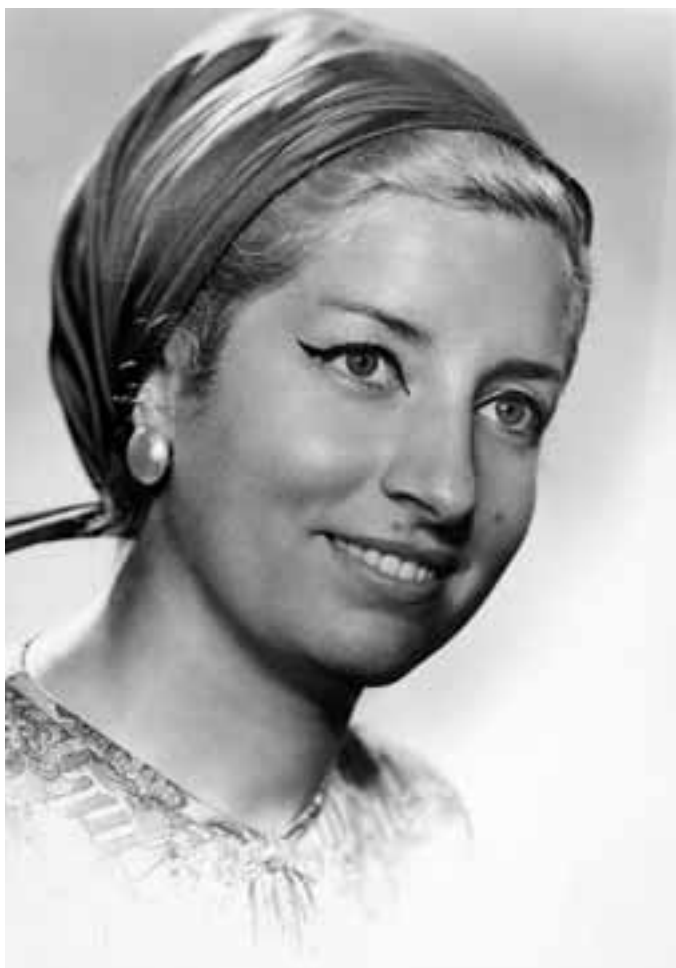
RETRATO. AÑO 1962

Desde 1956 he estado en la calle San Miguel, en un piso. Entonces se valoraban más los pisos para las galerías fotográficas, era más elegante, más discreto. Además los estudios tenían que contar con espacio para los focos de la época. Se empleaba mucho el arco voltaico con luz reflejada, muy suave y muy bonita. Lo malo era que los apagones de luz podían ser largos, de horas. También utilicé el magnesio, que había que manejarlo con precaución. Posteriormente llegaron las lámparas de tungsteno y al final los flashes con las grandes baterías de entonces... Los mismos cambios hubo