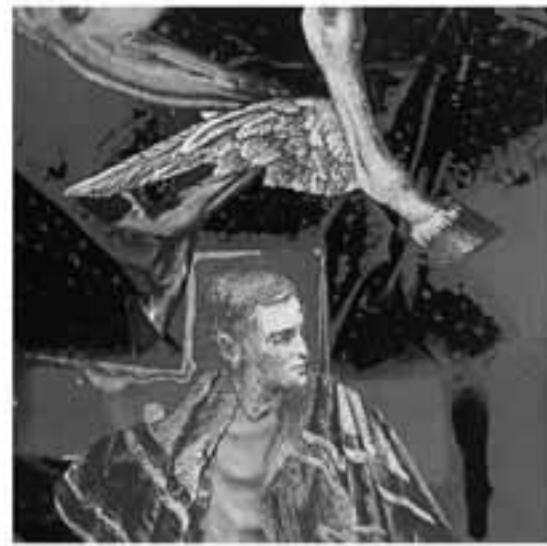
SIN TÍTULO (1991) ORIGINAL EN COLOR