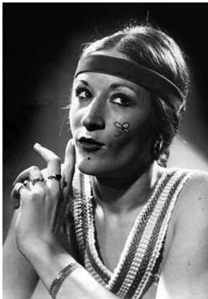
RETRATO. AÑO 1964