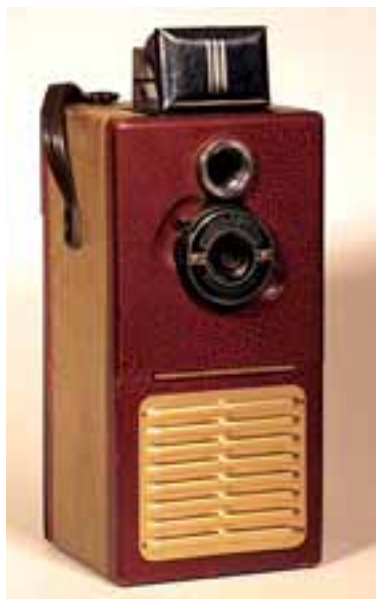
THOM THUMB CAMERA RADIO

El epílogo, ya dentro de la «era digital», lo pone Nokia con su teléfono 7250 en 2003, primero que integra en el teléfono una cámara digital y un receptor de FM. Posteriormente se han ido desarrollando muchos teléfonos con mejores prestaciones fotográficas y diversos añadidos digitales de sonido, navegación, comunicaciones, almacenamiento, etc., pero esto ya es el principio de otra historia.