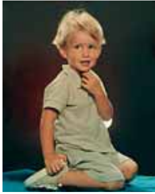
MI NIETO. AÑO 2005