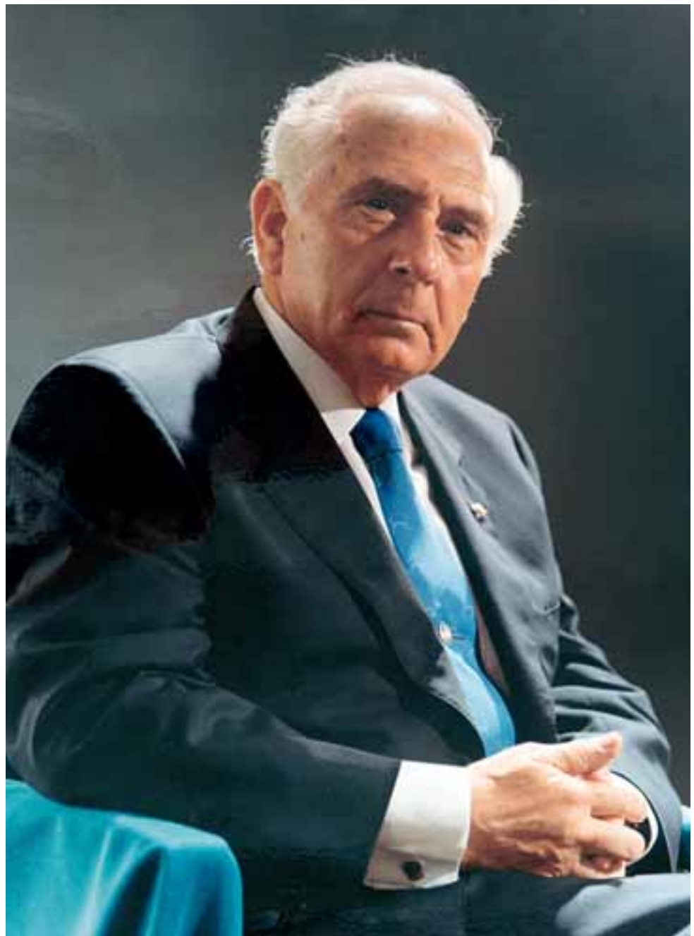
RETRATO. AÑO 1979

El que capta bien la psicología del cliente. El que tiene bien colocadas las luces y los efectos. El que posee una buena colocación de las manos y capta perfectamente la expresión del rostro y de la mirada de acuerdo con la manera de ser del retratado.