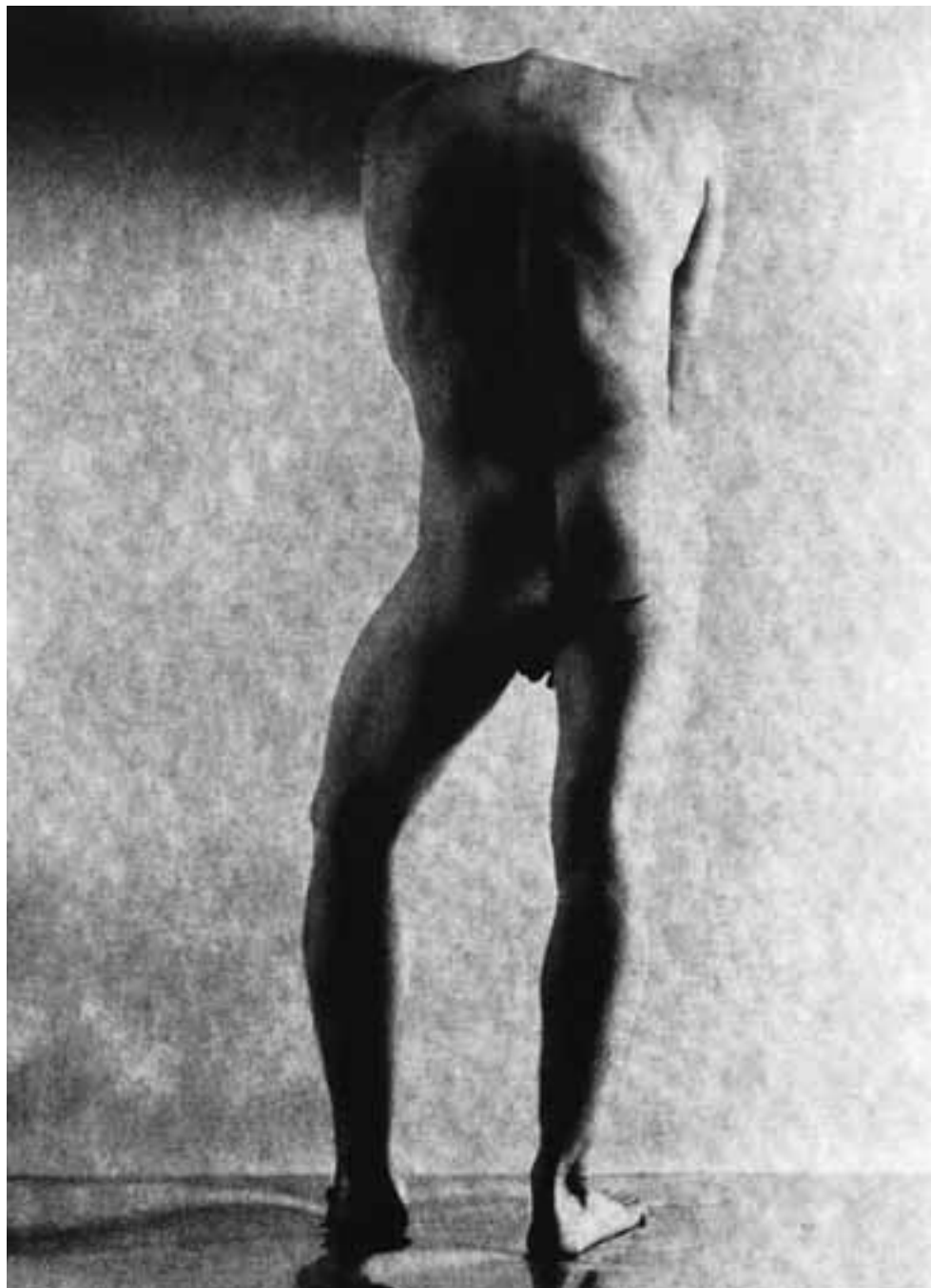
SOÑAR EN DIOSES NÚM. 59 (1988)