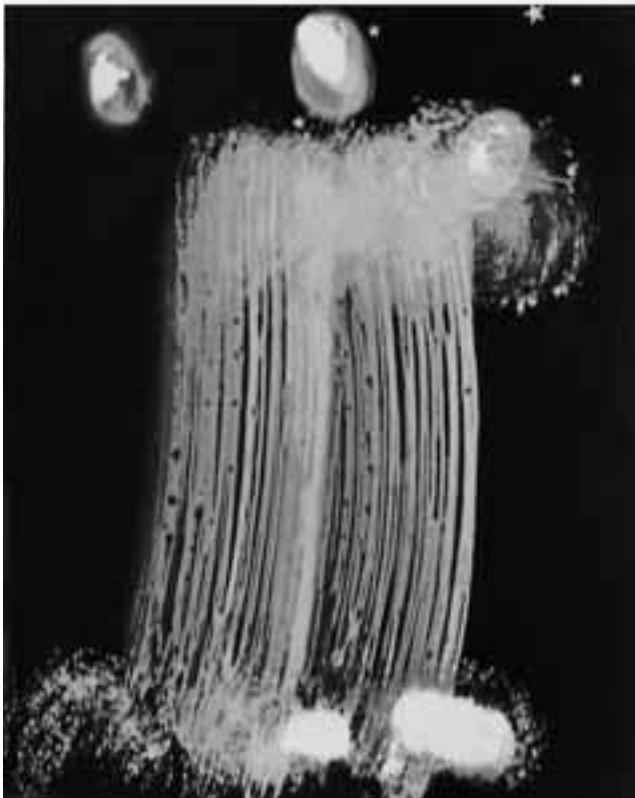
SERIE DE LOS DOGON, MALI (FRAGMENTOS) (1982)

antiguas y realizó un montaje de su obra inédita e inacabada.