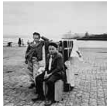
NIÑOS EMIGRANTES TRAS PERDER EL BARCO. PUERTO DE LA CORUÑA, 1960

Como Ramón y Cajal ya sentenció: la fotografía no