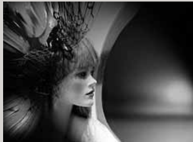
PRINCESAS TRAS EL CRISTAL 512

Mención de Honor en el 32nd Greater Lynn LYNN- Massachussets