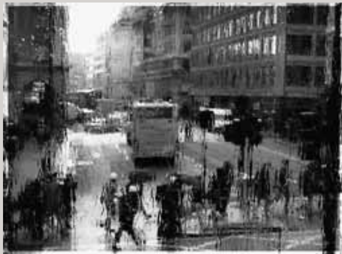
UNA MIRADA A LONDRES