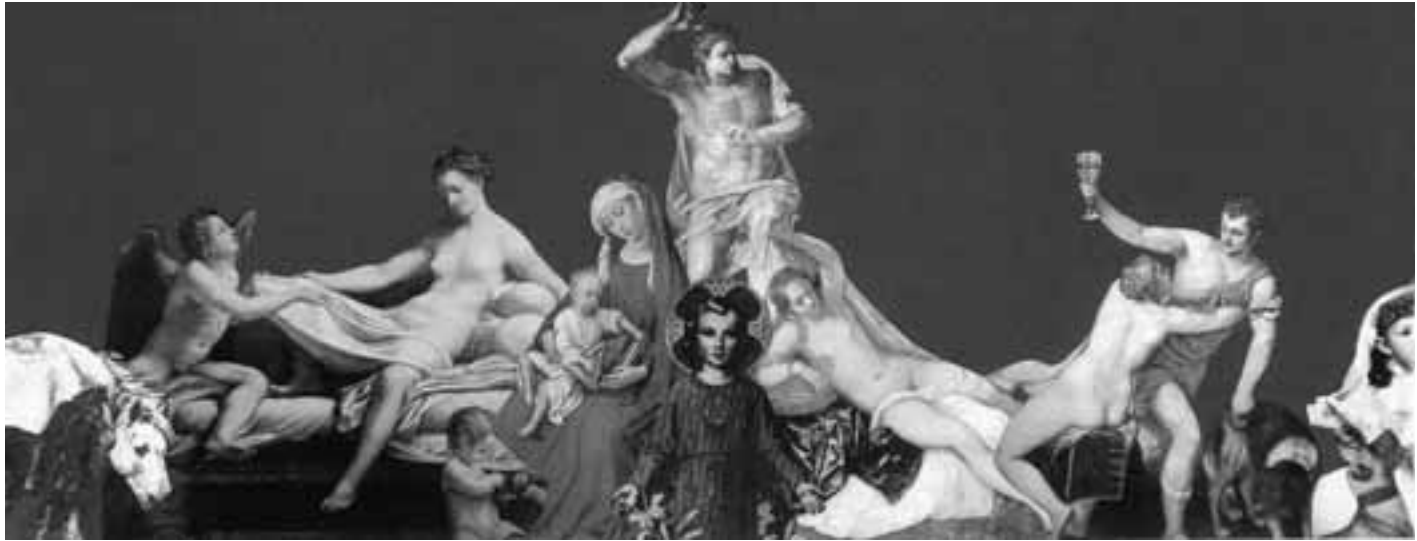
SIN TÍTULO (2006) ORIGINAL EN COLOR