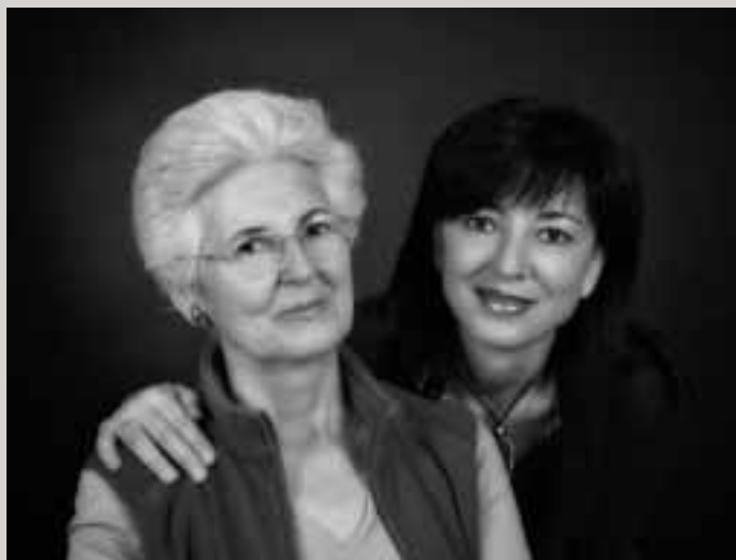
SALÓN DE PRIMAVERA Premio del año pasado.