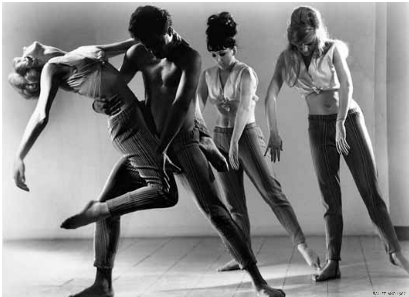
BALLET. AÑO 1967