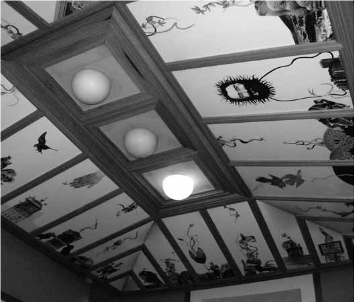
ARTESONADO DE LA ESCALERA DEL EDIFICIO PIGNATELLI (GOBIERNO DE ARAGÓN) (1986) ORIGINAL EN COLOR