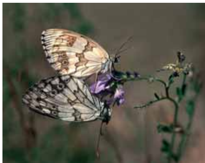
3º Premio. Concepción Escudero