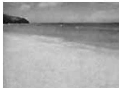
PLAYA MANZANILLO. MARGARITA, VENEZUELA (1999) ORIGINAL EN COLOR