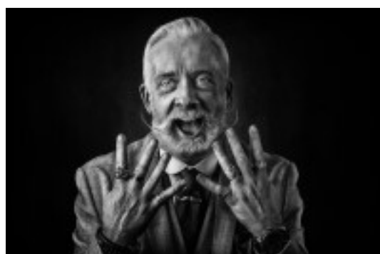
Dean Irvine de REINO UNIDO a la obra The laughing man

Mención de Honor de la FLF en la sección Color