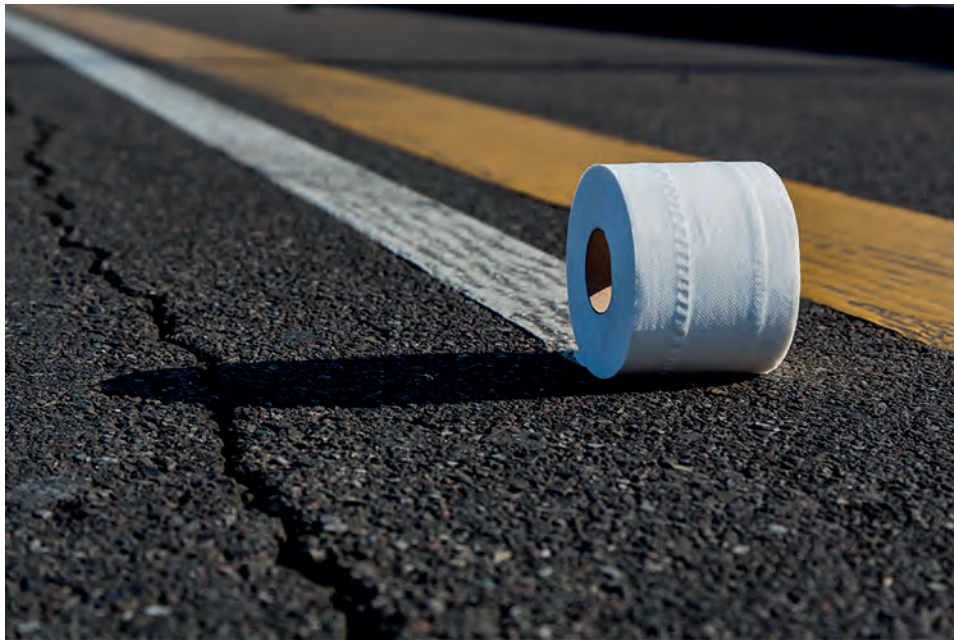
Lines on the asphalt. Giorgio Formenti . Mención de Honor de la FIAP