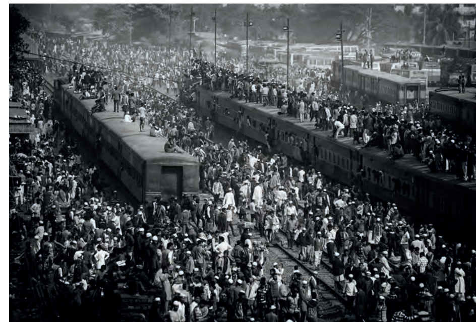
Railway station 0905. Garik Avanesian. Medalla de Oro de la CEF