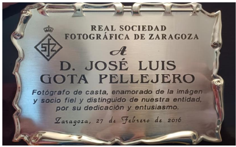
Placa homenaje.