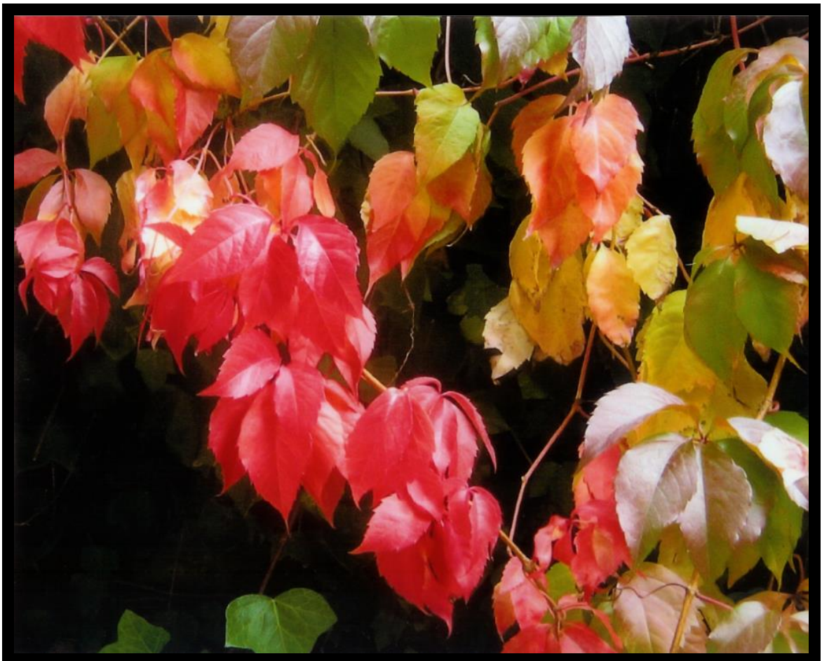
Estallido de colores