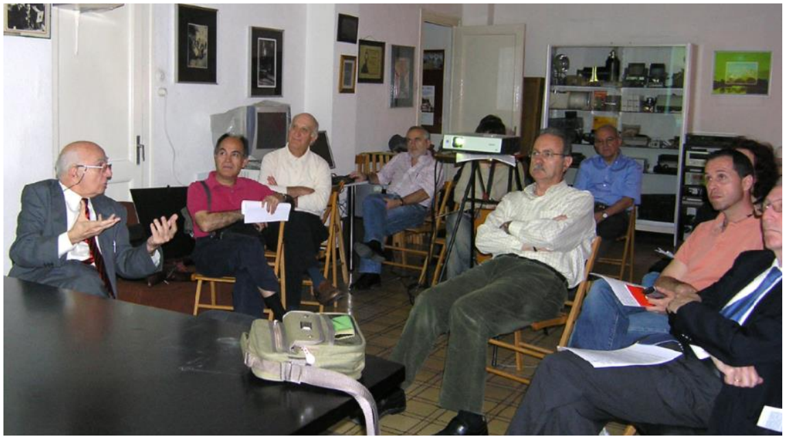
Charla en la Sede de la RSFZ en Plaza San Francisco, 2008.