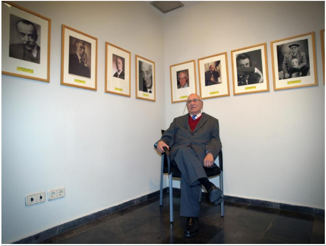
Inauguración "Retrospectiva". Sala Cuarto Espacio DPZ, 2013.