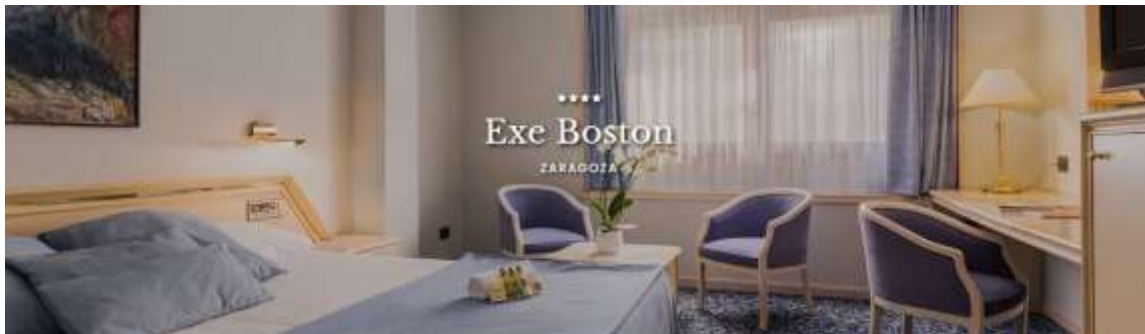
Hotel EXE BOSTON

Avda/ Camino de las Torres, 28; 50008 Zaragoza VER MAPA