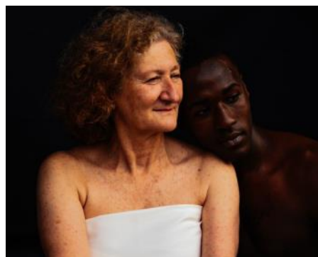
Accésit Premio Retrato sección Libre Javier Elola Convivencia